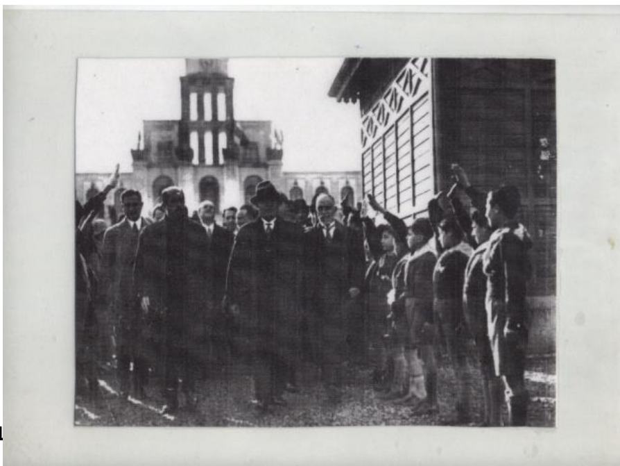
Aprile 1929: B.Mussolini inaugura l'edificio scolastico