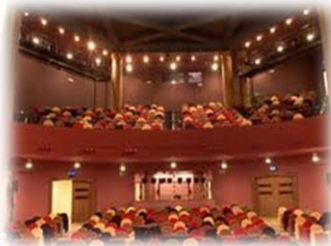
cinema e teatri