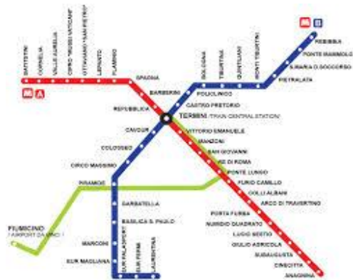
Trasporto pubblico: Autobus, metro e treno