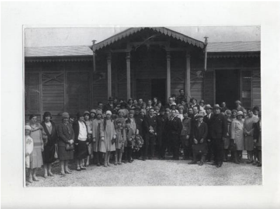
Anni 1928/29 -Docenti e Direttore Didattico davanti ai padiglioni di legno che ospitarono bambini in attesa della realizzazione dell'edificio scolastico

Con lo scoppio della guerra l'edificio perse la sua specifica funzione e nel 1943 venne requisito per circa un anno dall'esercito (21ª Divisione Granatieri) e sul terrazzo fu installata una postazione per la difesa antiaerea. Nel 1944 i locali della scuola furono assegnati agli sfollati che vi rimasero fino al 1953/54; circa 500 persone vivevano nelle aule che a volte ospitavano anche due famiglie separate da tende. Al termine della guerra la scuola tornò lentamente a funzionare, e cambio nome: fu infatti intitolata a Cesare Battisti, patriota che morì per la conquista del Trentino durante la seconda guerra mondiale.