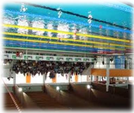
Centri sportivi privati e del CONI